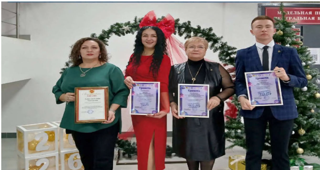
Ежегодная церемония награждения "Признание 2025"