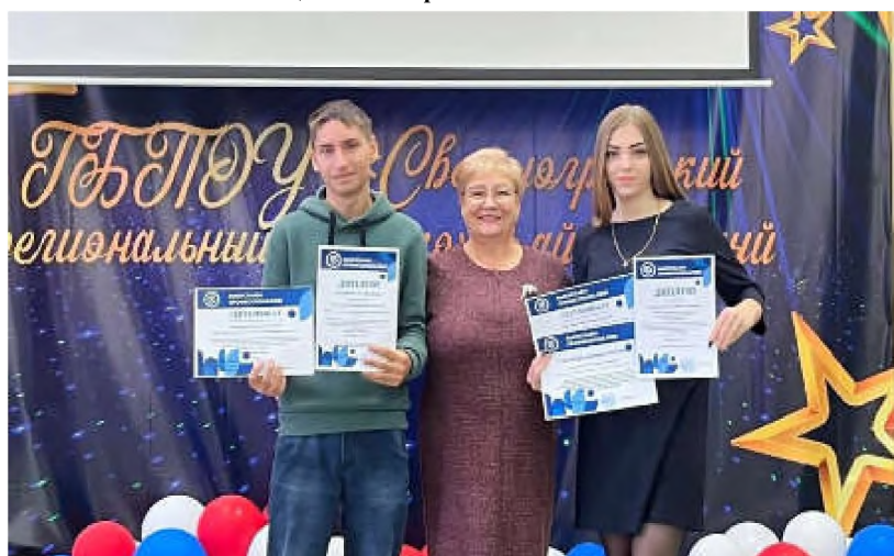
Краевой конкурс литературно-художественного творчества, посвященного 85-летию СПО