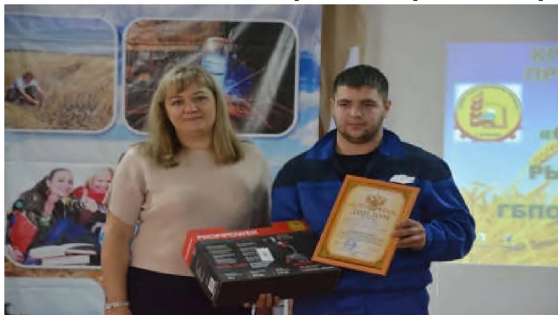
Краевая олимпиада профессионального мастерства по УГС 35.00.00 «Сельское, лесное и рыбное хозяйство».