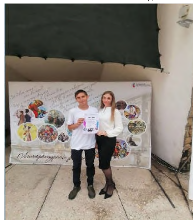
IX уличный литературный фестиваль «Погружение в классику»