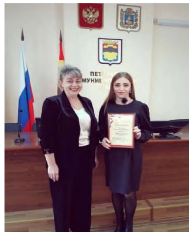
Конкурс социальных видеороликов антитеррористической направленности ПМО СК «Твой взгляд»